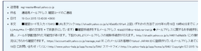
図2 メール受信画面

今回作成したメールシステムも一般的なメールシステムのようにメールの作成からメールの送信受信までできるようになっています。