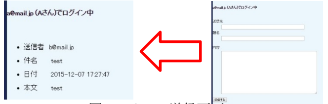
図3 メール送信画面

図2は送られてきたメールを受信して見ている所です。図3はメールを作成するフォームと送信後に送信履歴を表示している画面です。