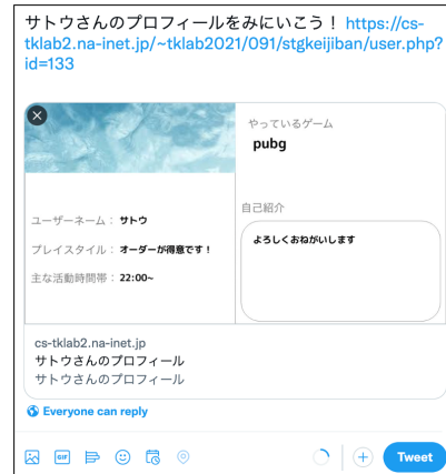
図 2 twitter 共有画面

ドとして、共有することが可能である。図 2 は twitter に共有する際に使う画像の例である。