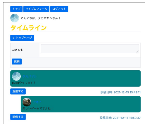
図 3 タイムライン

タイムラインではゲームごとにチャットをすることが可能である。ユーザーログイン時は投稿・観覧ができるが非ログイン時は観覧のみが可能となっている。投稿に対して返信もでき、返信すると、図 3 のように左側から少し離れてコメントが投稿される。