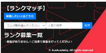
図2 メンバー募集ページ

・メンバー募集機能…ランクマッチやカジュアルプレイのメンバーを募集できる機能を実装しました。ユーザーはランク帯やプレイスタイルを設定し、条件に合うプレイヤーを探せます。さらに、Discord 招待リンクを自動生成することで、募集からボイスチャットへの移行もスムーズに行えます。