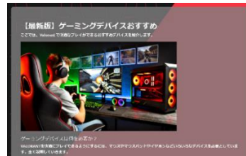
図3 デバイス紹介ページ

・デバイス紹介ページ…おすすめのゲーミングデバイスを紹介・共有できる機能を実装しました。また、各デバイスにはアフィリエイトリンクを設置し、ユーザーが気に入ったデバイスをそのまま購入できる仕組みも導入しています。これにより、ユーザーは自分に合ったデバイスを見つけやすくなり、サイトの収益化にもつながる設計となっています。